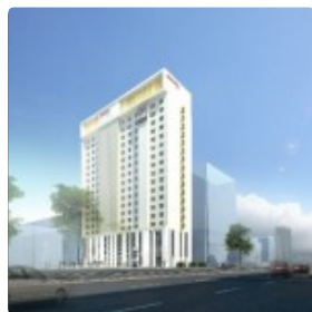
Hampton by Hilton już w maju