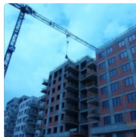
Na budynkach etapu IIA Sokratesa Park & Art w Warszawie zawiąza wiecha