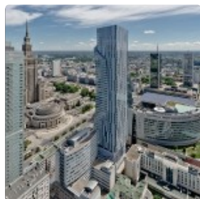
Numer jeden przy Rondzie ONZ - fotorelacja